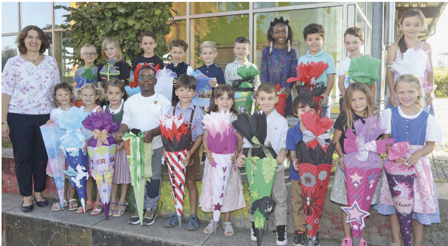
Klasse 1b, Grundschule Hohenpolding