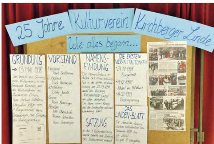
Ausgestellte Collage mit den Anfängen des Kulturvereins Kirchberger Linde