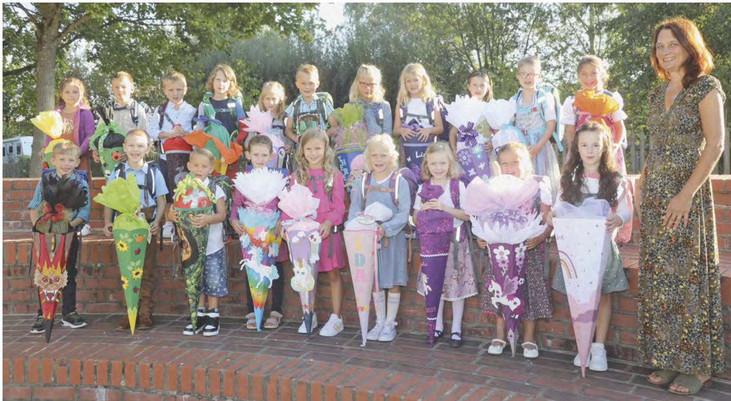
Klasse 1a, Grundschule Schröding